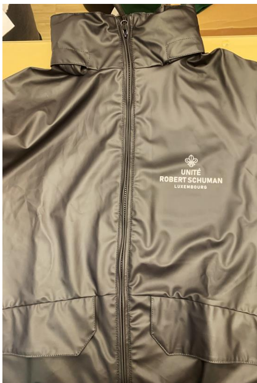
Face avant avec le nom de notre groupe

Ce vêtement pratique, performant et semble-t-il durable, est parfaitement adapté à nos activités qui se déroulent toujours en extérieur et, sauf cas de force majeure, par tous les temps. Le vêtement coûte 60€ par exemplaire. Nous les vendons à prix coûtants à nos membres. Voici le résultat :