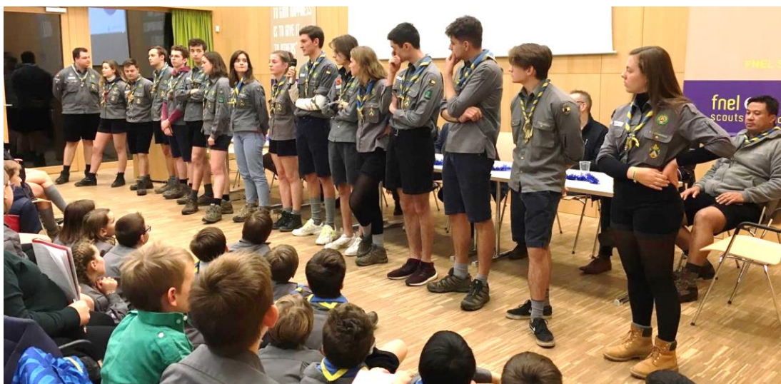
L'équipe des Chefs 2019/2020 lors de notre traditionnelle Veillée de Noël - Décembre

L'équipe des Chefs et les membres du Comité sont tous des bénévoles qui prennent sur leur temps libre pour s'occuper de notre groupe et de ses membres. Personne à l'Unité Robert Schuman ne perçoit de rémunération pour le temps qu'il y dédie.