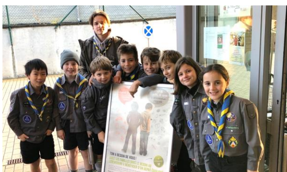
La « blanche » était à Hesperange avec Phao

Sur place, les louveteaux se sont vu confier la responsabilité de sensibiliser les clients de Delhaize sur l'action « Buttek » menée par la Croix-Rouge et l'association Spëndchen. Elle vise à récolter des fonds pour l'achat en gros de denrées alimentaires pour fournir des épiceries sociales du pays. Les louveteaux ont pris leur tâche à cœur et n'ont laissé personne sortir du magasin avant qu'ils n'aient pris connaissance de l'action en cours.