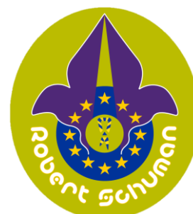
Notre logo précédent