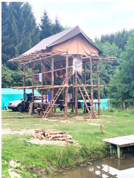
Le « pilotis » des Chefs

SP arrivent trois jours avant les autres pour débiter ce que nous appelons les constructions. En trois jours, ils terminent les installations des Chefs et celles destinées à l'ensemble de la Troupe, pour que les autres participants puissent arriver dans de bonnes conditions. Dès leur arrivée, chaque patrouille s'occupe de construire son propre coin. Celui-ci est généralement au moins composé d'une table à manger, d'une table à feu (ce qui nous sert de cuisinière) et d'un pilotis. Celui-ci nous permet de dormir en hauteur afin d'éviter au maximum les désagréments de l'humidité et du sol inconfortable. Voici quelques photos :