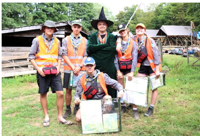
Le Chef de Troupe et les CP avant leur départ en Hike

Après trois jours de constructions (6 pour ceux qui arrivent plus tôt), le camp peut enfin commencer. De nouvelles activités sont conçues chaque année par l'équipe des Chefs, mais comme pour le camp de la Meute, il y a des incontournables qui reviennent chaque année. C'est le cas notamment du Hike qui est une marche de trois jours en patrouille. Après avoir préparé un itinéraire, et avec un téléphone et un peu d'argent en poche, les patrouilles partent chacune de leur côté pour environ 20 à 30 km de marche par jour en autonomie. Le soir, elles retrouvent les Chefs dans un des villages sur leur chemin pour que ceux-ci s'assurent que tout se passe bien, et puis les patrouilles s'activent pour trouver un endroit où dormir. Cela peut être chez l'habitant, dans une grange sur une bonne botte de foin ou encore dans une salle de la mairie qui leur est mis à disposition. Aventures et souvenirs garantis !