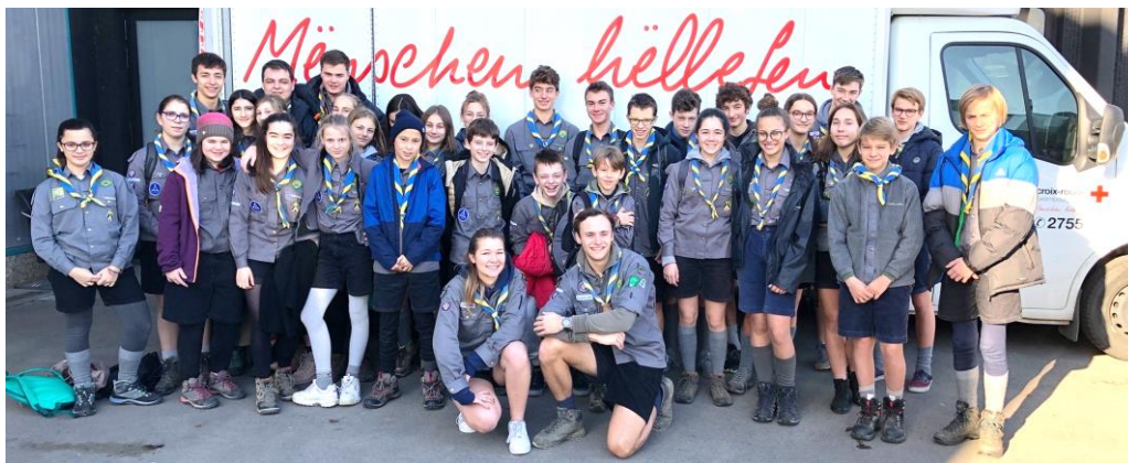
Toute la Troupe réunie devant le centre de collecte et de tri national