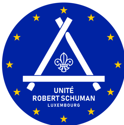
Notre logo actuel. Il a commencé à être utilisé en septembre 2019.