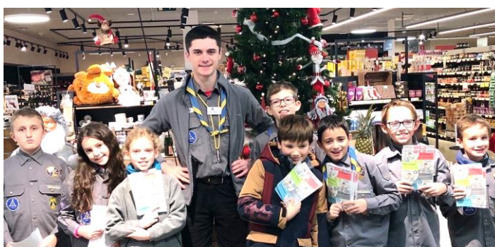
La « noire » était à Bertrange avec Kaa