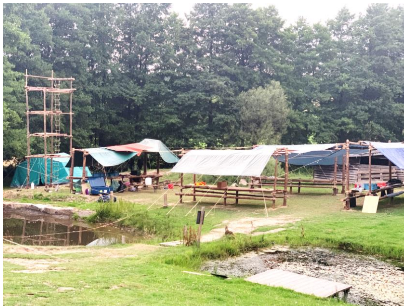
Les installations communes (tables, table à feu, mirador, etc.)

Après trois jours de constructions (6 pour ceux qui arrivent plus tôt), le camp peut enfin commencer. De nouvelles activités sont conçues chaque année par l'équipe des Chefs, mais comme pour le camp de la Meute, il y a des incontournables qui reviennent chaque année. C'est le cas notamment du Hike qui est une marche de trois jours en patrouille. Après avoir préparé un itinéraire, et avec un téléphone et un peu d'argent en poche, les patrouilles partent chacune de leur côté pour environ 20 à 30 km de marche par jour en autonomie. Le soir, elles retrouvent les Chefs dans un des villages sur leur chemin pour que ceux-ci s'assurent que tout se passe bien, et puis les patrouilles s'activent pour trouver un endroit où dormir. Cela peut être chez l'habitant, dans une grange sur une bonne botte de foin ou encore dans une salle de la mairie qui leur est mis à disposition. Aventures et souvenirs garantis !