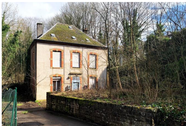
La ville de Luxembourg a proposé le terrain de cette bâtisse au Limpertsberg pour faire office de home pour notre groupe après les travaux nécessaires.