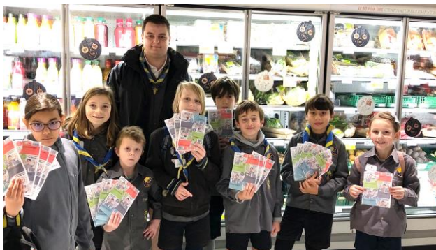
La « brune » était à Belval avec Akela