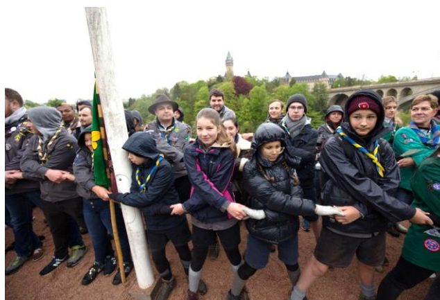
Raccoon, Ailurus, Lionceau, Castor, Suni, Cetonix, Misaki et Sheltie ont participé à la chaîne des adieux.