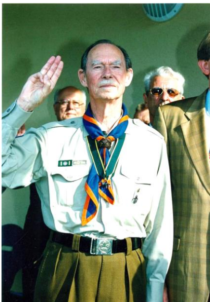
Le Grand-Duc Jean avait été nommé Chef Scout de la "Luxembourg Boy Scouts Association" en 1945, son intérêt pour le scoutisme n'avait jamais faibli depuis.

À la suite du décès de Son Altesse Royale le Grand-Duc Jean, le 23 avril 2019, un deuil national a été décrété au Luxembourg. Les funérailles de l'ancien chef de l'État du Grand-Duché de Luxembourg furent organisées le samedi 4 mai 2019.