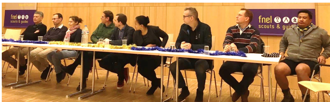
Une partie du Comité lors de notre traditionnelle Veillée de Noël - Décembre 2019

En février 2020, deux membres du comité ont malheureusement démissionné pour raisons personnelles. Ils ne figurent pas dans le tableau ci-dessus. Nous sommes reconnaissants pour le temps qu'ils ont dévoué à l'URS.