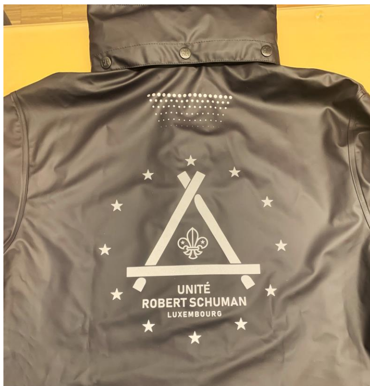
Face arrière avec notre logo. La couleur utilisée est réfléchissante.