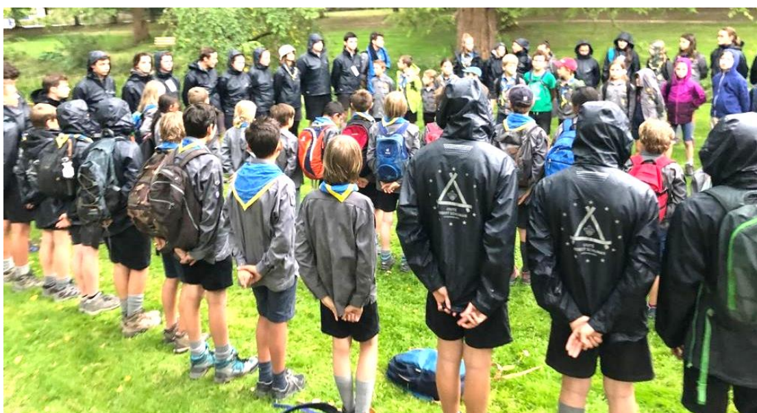
Quelques-uns de nos membres ont déjà reçu leur veste lors de la rentrée scout de septembre 2019