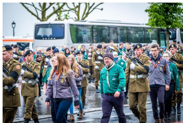
Après l'hommage place de la Constitution, les scouts ont rejoint l'armée pour former une haie d'honneur.