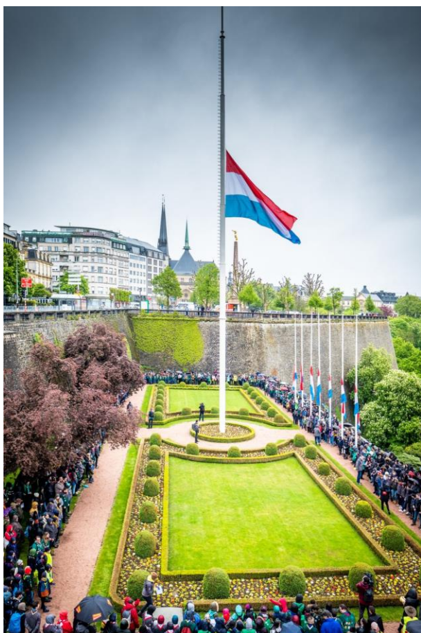
Nous nous sommes retrouvés place de la Constitution à Luxembourg avec des scouts de tout le pays.

Son Altesse Royale le Prince Héritier Guillaume, dans les pas de son grand-père, a été intronisé Chef Scout National le 10 octobre 2019. Nous étions avec de centaines d'autres scouts à la Kinnekswiss à Luxembourg pour participer à cette cérémonie.