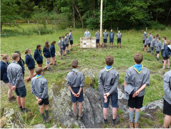
Chaque journée commence par un rassemblement en uniforme pour le lever du drapeau