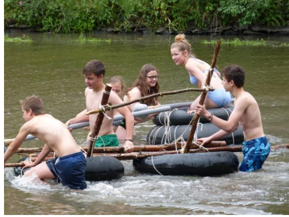
De nombreuses activités sont proposées aux enfants, comme des descentes de rivières.

Chaque jour est l'occasion de nouveaux jeux et d'activités sur le thème du camp, en voici les principaux :