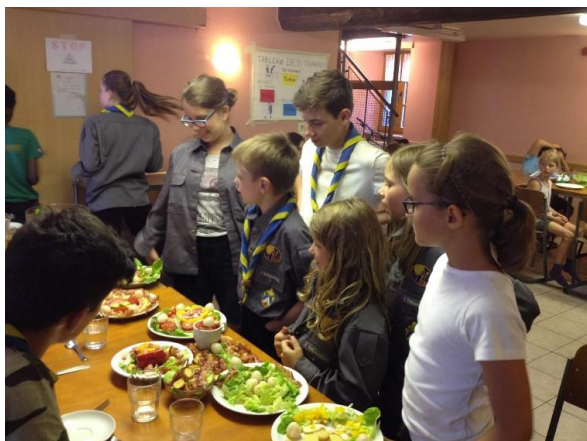
À chaque repas, les louveteaux mangent entre sizaines afin de renforcer l'amitié entre eux et d'intégrer les nouveaux arrivants

Quand l'été arrive, que l'école s'arrête et que les vacances commencent, chaque enfant veut partir en vacances. Que ce soit en famille ou avec des amis, en restant « à la maison » ou en voyageant, les vacances d'été sont un excellent moment pour se changer les idées et faire des choses différentes que d'habitude. Beaucoup d'enfants et jeunes adultes décident chaque année de partir à l'aventure seule ou avec des amis en colonie ou camp de vacances. Ce genre de vacances est largement apprécié, car il permet de changer d'air, de partir sans ses parents et de rencontrer plein de nouvelles personnes tout en faisant des activités. En général ces camps sont la garantie de belles amitiés et de souvenirs qui resteront pour longtemps.