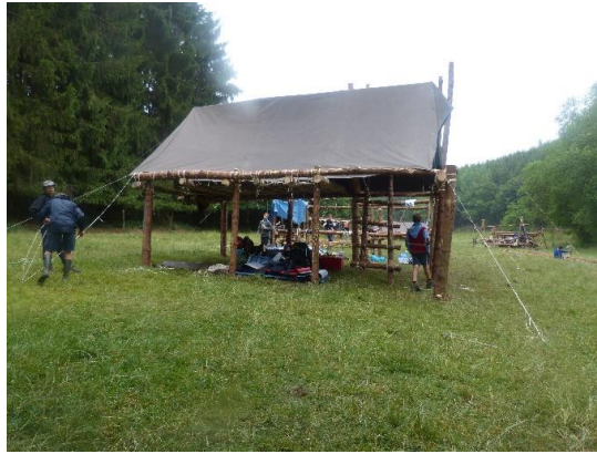
La tente est installée sur le pilotis.

Suite au pré-camp durant lequel toutes les tentes nécessaires au staff sont installées (tente pour dormir, tente affaires, tente infirmerie, tente intendance pour la nourriture, tente pour la haute patrouille) et les constructions bien entamées (table à feu pour cuisiner, table à manger pouvant accueillir 40 à 50 personnes, pilotis pour la tente), tous les scouts sont conduits au terrain en bus et entament leurs propres constructions par patrouilles. Là aussi, ils devront construire leur propre table à manger et à cuisiner, leur pilotis afin d'y monter leur tente. Cette étape des constructions dure généralement 3 jours.