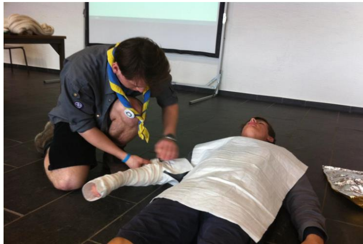
Deux Chefs de l'Unité Robert Schuman lors de la formation Bosses & Bobos par la FNEL

Le cursus de formation des Chefs à la FNEL s'apparente au cursus « BAFA Scout » en France, ou encore au Brevet d'Animateur Scout en Belgique. Les diplômés d'ANIMATEURS sont requis pour la conduite de jeunes en activités de plein air et sont harmonisés entre les États membres de l'Union Européenne. Ces diplômés se préparent en 2 ans.