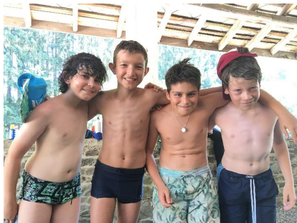
Des amitiés se forment qui durent pendant toute la période du scoutisme et perdurent parfois aussi après !

Les louveteaux de l'Unité Robert Schuman, ont la possibilité d'en faire de même. Chaque année, un camp louveteaux de 8 jours est organisé par les chefs louveteaux. Le plus souvent il se déroule sur le sol luxembourgeois, mais il peut aussi exceptionnellement se dérouler à l'étranger. En tous les cas, il se déroule dans une zone isolée par rapport à la vie citadine.