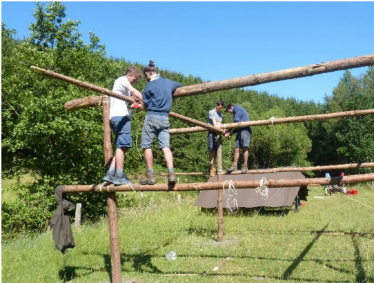
Construction de la structure d'un pilotis, afin de pouvoir mettre les tentes en hauteur.

Le camp scout prend place de manière générale au cours de la deuxième moitié du mois de juillet et commence avec un pré-camp de 2 à 3 jours qui implique le staff chef/intendant ainsi que les scouts les plus âgés qui constituent la haute patrouille (chefs de patrouilles, et leurs seconds si davantage de main d'œuvre s'avère nécessaire). C'est lors de ce pré-camp que tout le matériel nécessaire au bon déroulement du camp est transporté jusqu'au lieu du camp, généralement une plaine d'un hectare louée en Belgique.